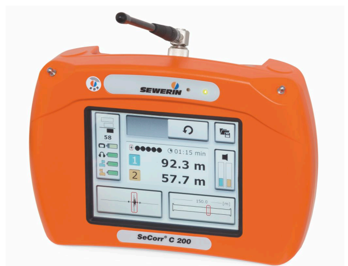
Receptor SeCorr® C 200