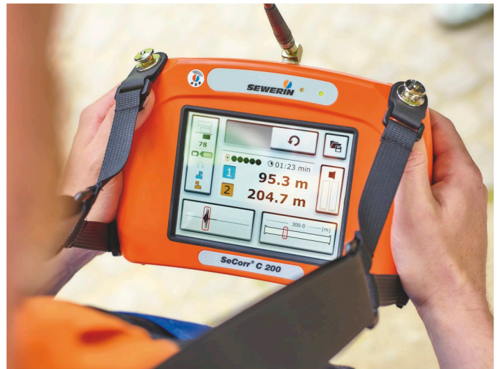
Resultado de medición en la pantalla del SeCorr® C 200