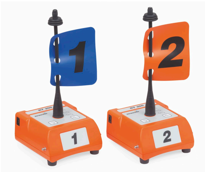
Radio transmisor RT 200

Además, gracias a la vista orientada a los resultados, el usuario puede iniciar otros pasos de inmediato, como la localización por métodos acústicos.