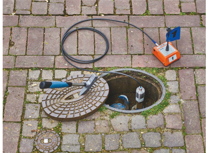
Radio transmisor RT 200 con micrófono UM 200 en uso

El SeCorr® C 200 presenta un manejo sencillo y ergonómico. Dotado de una correa triangular estable, permite llevarlo de forma óptima y sin cansarse. La carcasa compacta y de diseño simétrico permite un manejo que resulta cómodo tanto para usuarios diestros como para zurdos. La comunicación entre el receptor y los auriculares se realiza de forma inalámbrica, por lo que el usuario puede trabajar sin molestias.